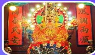
วัดเจ้าแม่กวนอิมเทียนหัว