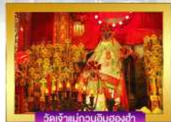
วัดเจ้าแม่กวนอิมฮองฮ่า