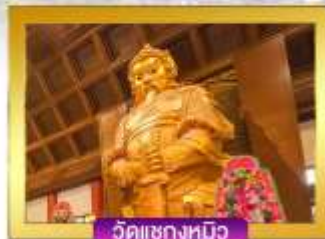
วัดเซกงหมิว