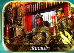
วัดกวนโท

ไหว้ 8 เซียนวัดดั่ง ปังไม่หยุด ครบถ้วน!! การเงิน การงาน ความรัก และสุขภาพ นั่งรถราง PEAK TRAM, ชมวิวยอดเขาวีคตอเรีย, เจ้าแม่กวนอิมหาดริฟลิสันต์, วัดหลินฟ้า, วัดเจ้าแม่ทับทิม วัดหวังต้าเซียน, วัดกวนโท, วัดอองซ่า, วัดเขangkงหมิว, กระเช้านองปิง 360, พระใหญ่เทียนทาน