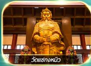
วัดเขangkงหมิว