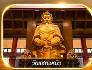
วัดเขกงหมิว