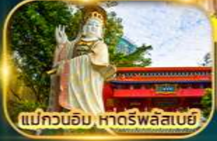
แม่กวนอิม หาดรพลัสเบย์