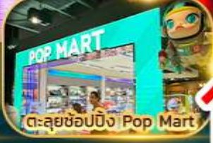
ต.ลุยช้อปปิ้ง Pop Mart