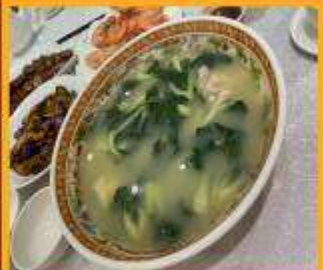
ซุปรังใส่หมู