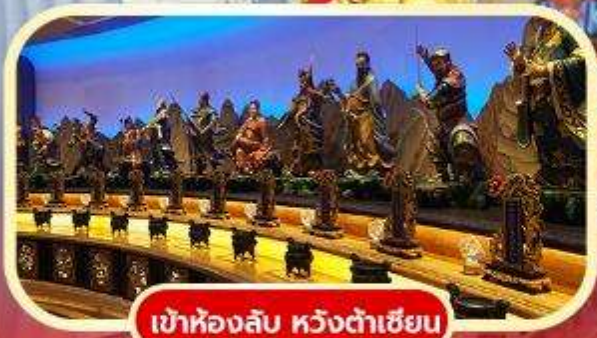
เข้าห้องลับ หวังต้าเซียน