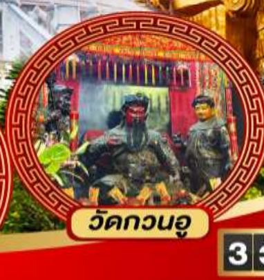
วัดกวนอู