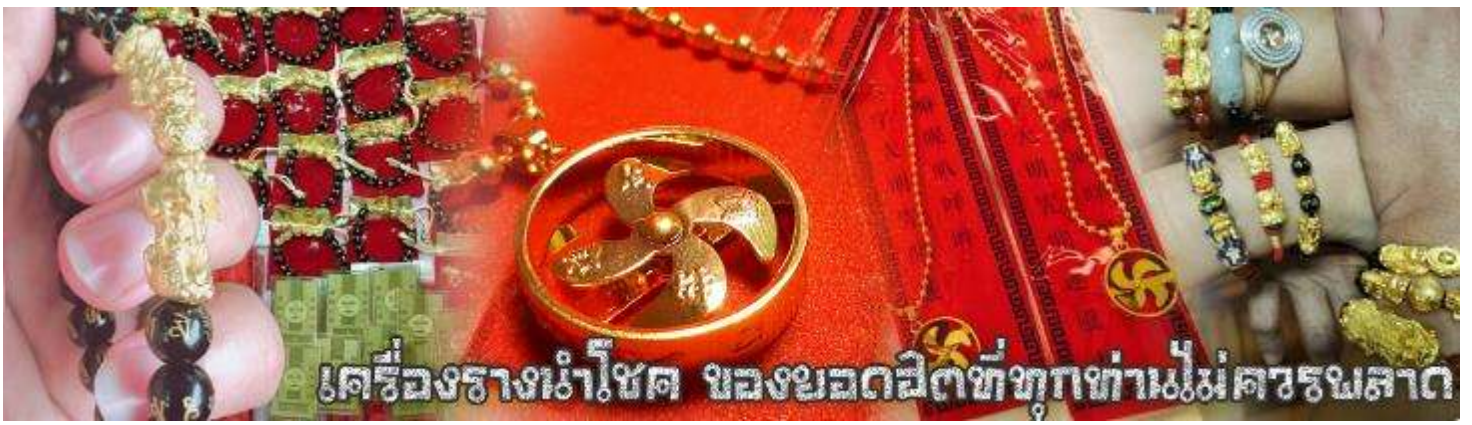
เครื่องรางนำโชค ของยอดฮิตที่ทุกท่านไม่ควรพลาด

จากนั้นนำท่านสู่ ร้านหยก ชมความงามปีเซี่ยะ ที่เชื่อกันว่าเป็นวัตถุมงคลยอดนิยม ที่มีการนำมาบูชา เพื่อให้ช่วยป้องกันสิ่งชั่วร้าย เรียกทรัพย์สินเงินทองให้ไหลมาเทมา และกักเก็บทรัพย์นั้นไม่ให้รั่วไหลออกไปไหนได้ ชาวจีนโบราณเชื่อกันว่า ปีเซี่ยะเป็นสัตว์ประหลาดที่รวมลักษณะของสัตว์มงคลทั้ง 5 ชนิดไว้ด้วยกัน ได้แก่ มังกร พญาราชสีห์หรือสิงโต, อินทรี, กวาง, และแมว โดยตามตำนานเล่าว่า ปีเซี่ยะเป็นลูกมังกรตัวที่ 9 (เทพแห่งโชคลาภ) ของพญามังกรสวรรค์ มีชื่อเรียกด้วยกันหลายชื่อไม่ว่าจะเป็น “เทียนลก (กวางสวรรค์)” เป็นชื่อเดิม ส่วนเงินกวางตุ้งจะเรียกว่า “เผ่เย้า” และคนจีนแต้จิ๋วจะเรียกว่า “ผิซิว” และ ยังมีจำหน่ายยาสมุนไพรบำรุงเพิ่มความแข็งแรงตามความเชื่อของคนฮ่องกง สมควรแก่เวลานำคณะสู่สนามบินฮ่องกง