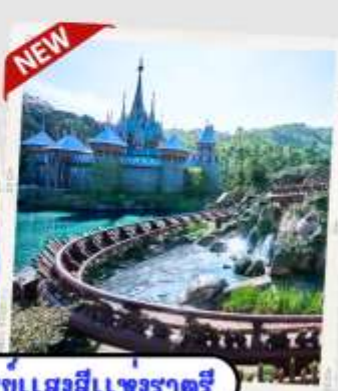
"MOMENTOUS" ชาติศรทรงแสงมีแสงราตรี