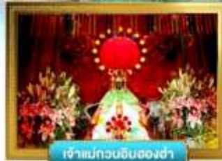
เจ้าแม่กวนอิมฮ่องซ่า