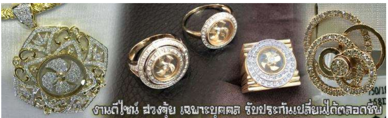
งานดีไซน์ สวยหรู เฉพาะบุคคล รับประกันเปลี่ยนไม่ตัดตลอดชีพ

นำท่านเยี่ยมชม โรงงานจิวเวลรี่ ที่ขึ้นชื่อของฮ่องกงพบกับงานดีไซน์ที่ได้รับรางวัลอันดับยอดเยี่ยม และใช้ในการเสริมดวงเรื่อง ฮวงจุ้ยนำความโชคดี มั่งคั่งแก่ผู้สวมใส่ ซึ่งในเมืองไทยก็ได้นิยมแพร่หลายออกไป ไม่ว่าจะเป็นกลุ่มดารา นักการเมือง พ่อค้าแม่ขายที่ประกอบธุรกิจ เจ้าของกิจการห้างร้านต่างๆ ซึ่งเชื่อกันว่าจะนำสิ่งดีๆ ปิดเป่าสิ่งชั่วร้ายให้กับบุคคลที่สวมใส่ ซึ่งจะมีมากมายหลายชนิด เช่นจี้กังหัน แหวนรุ่นต่างๆ นาฬิกาข้อมือ (ซึ่งผู้สวมใส่จะได้รับการดูลายมือจากซินแซประจำร้าน เพื่อแนะนำวิธีการเสริมดวงในการสวมใส่โดยไม่คิดค่าบริการ)