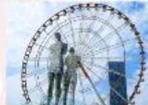
รูปปั้นอาลีและนีโน