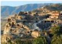
เมืองอุพลิสซิเค