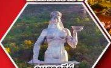
อนุสาวรีย์