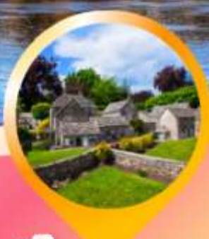
เบอร์ตันออนเดอะวอเตอร์