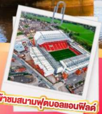
เข้าชมสนามฟุตบอลแอนฟิลด์

เมนูสุดพิเศษ!! Fish & Chips อาหารไทย และ ภัตตาคารดัง Four Season