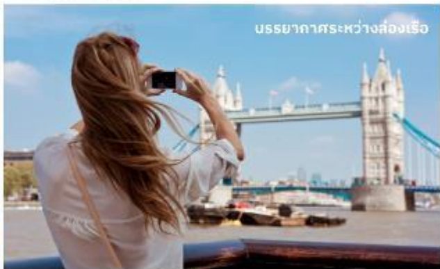
บรรยากาศระหว่างส่องเรือ

ชมทิวทัศน์งดงามของสองฝากฝั่งแม่น้ำเทมส์ ซึ่งไหลผ่านกลางกรุงลอนดอน ส่องเรือผ่านสถานที่สำคัญต่างๆ เช่น จัตุรัสรัฐสภา, พระราชวังเวสต์มินสเตอร์, ลอนดอนอาย, กาวเวอร์ออฟลอนดอน และ กาวเวอร์บริดจ์