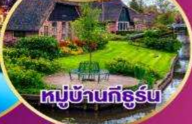
หมู่บ้านกังธูร์น