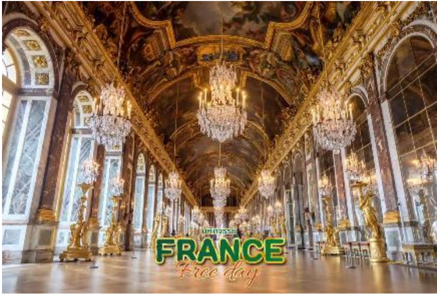
กับชาติยุโรปในประเทศไทย

MUST DO ห้องกระจก แห่งแวร์ซายเป็นอีกหนึ่งหน้า ประวัติศาสตร์ของไทยครั้งสมเด็จพระนารายณ์มหาราชทรงส่ง คณะทูตไปเจริญสัมพันธไมตรีกับ พระเจ้าหลุยส์ที่ 14 นำโดยออก พระวิสุทธิสุนทร ในวันที่ 1 กันยายนปี พ.ศ. 2229 (1686)นับเป็นการส่งคณะทูต สำเร็จอย่างเป็นทางการครั้งแรก