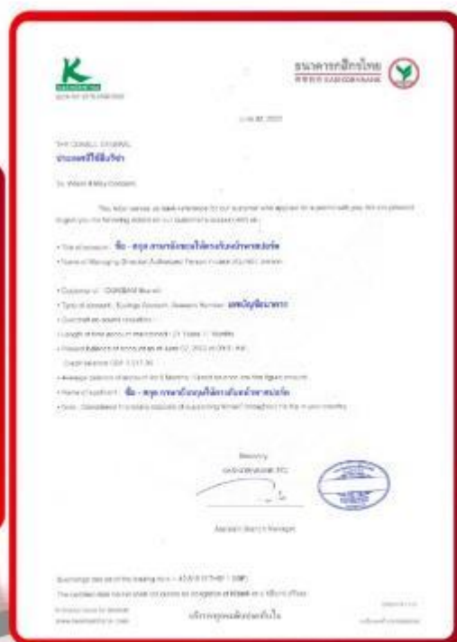
ตัวอย่าง Bank Guarantee ที่ผู้สมัครต้องขอจากธนาคาร