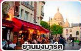
ย่านมงมาร์ต