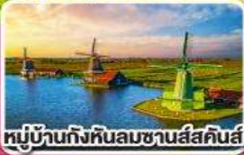
หมู่บ้านกังหันลมชาวนัสคิมส์