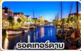
รอดเทอร์ดาบ