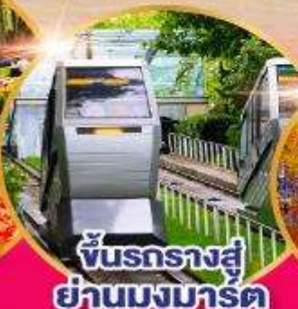
ชั้นรถรางสู่ ย่านมงมาร์ต