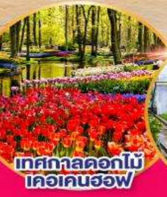
เทศกาลดอกไม้ เคอเคนฮอฟ