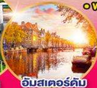
อัมสเตอร์ดัม