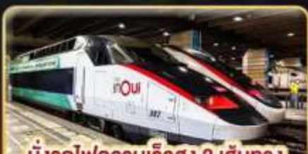
นั่งรถไฟความเร็วสูง 2 เส้นทาง PARIS - LYON & VENICE - ROME

📅 เดินทาง : 11-20 ก.พ. 68 / 15-24 มี.ค. 68 05-14 เม.ย. 68 / 29-08 พ.ค. 68