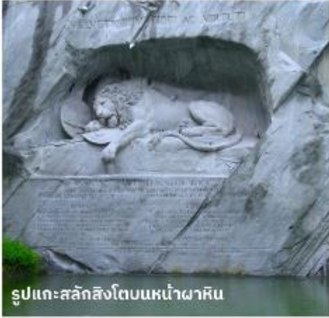
รูปแกะสลักสิงโตบนหน้าผาหิน