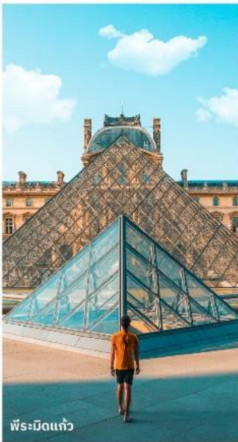
พีระมิดแก้ว

เดินทางสู่ พิพิธภัณฑ์ลูฟร์ ให้ท่านได้ถ่ายรูปด้านหน้า พีระมิดแก้วของพิพิธภัณฑ์ลูฟร์ เป็นพิพิธภัณฑ์ทางศิลปะที่มีชื่อเสียงที่สุด เก้าแก่ที่สุดและใหญ่ที่สุดแห่งหนึ่งของโลก