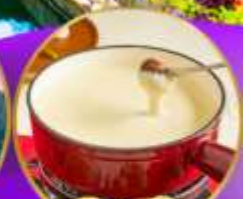
ฟองดูชีส