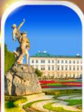
MIRABELL PALACE AUSTRIA