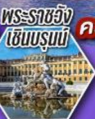
พระราชวัง เซินบรุนน์

เข้าชม ความงดงามและความอลังการ ของพระราชวังเซินบรุนน์