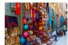
ตลาดข่านเอลคาลิลี

20.50 น. ออกเดินทางสู่อิสตันบูล เที่ยวบิน TK695