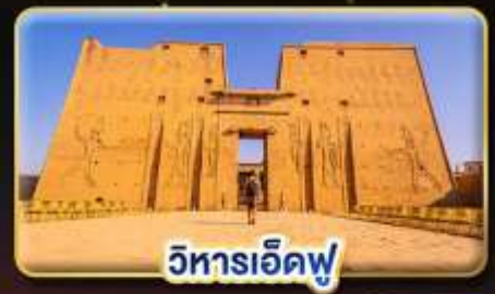
วิหารเอ็ดฟู

น้ำหนักกระเป๋า 23Kg. (เป็นระหว่างประเทศ และบินภายใน)