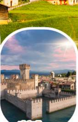
ซิร์มีโอเน