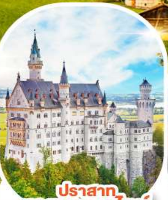
ปราสาท นอยชวานชไตน์