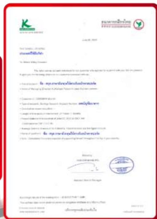
ตัวอย่าง Bank Guarantee ที่ผู้สมัครต้องเตรียมมาหาเรา