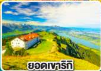
ยอดเขาริกิ