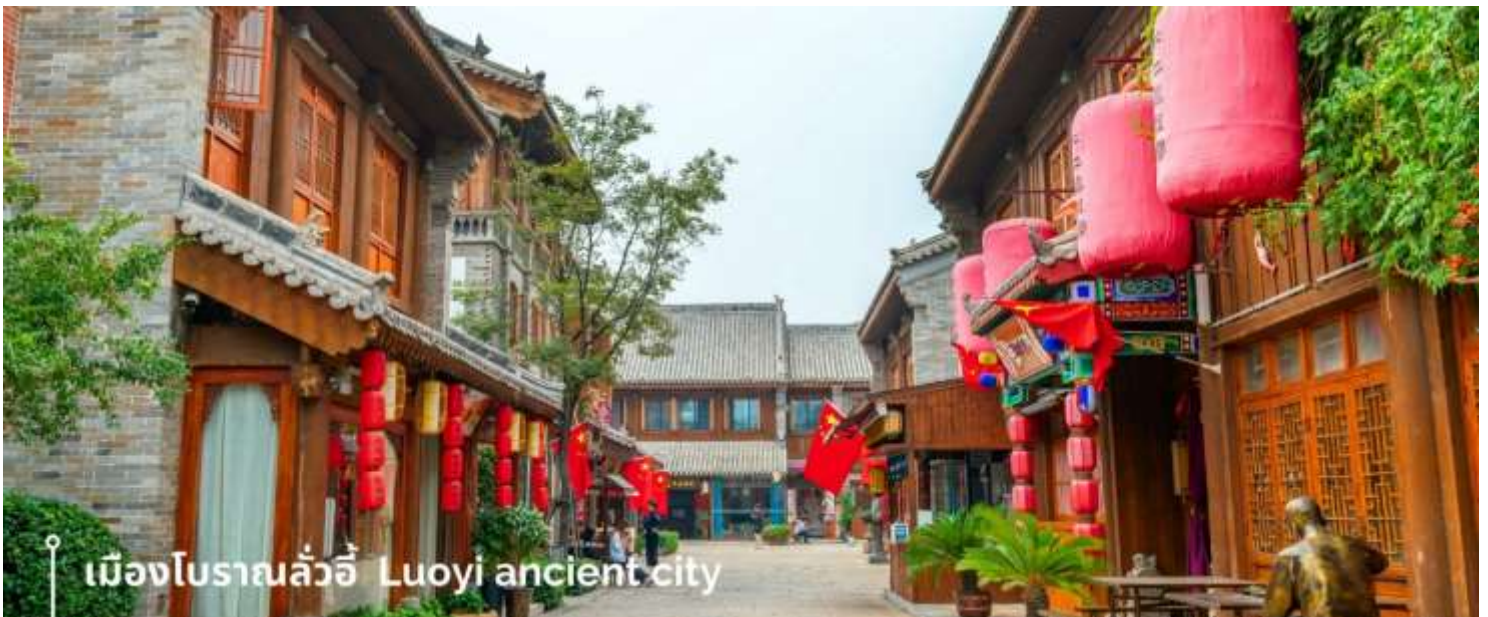
เมืองโบราณลั่วอี้ Luoyi ancient city

นำท่านเที่ยวชม เมืองโบราณลั่วอี้ เป็นสถานที่ท่องเที่ยวระดับ 1A ตั้งอยู่ในเมืองเก่าของเมืองลั่วหยาง เมืองหลวงโบราณของราชวงศ์ทั้ง 13 ราชวงศ์ บรรยากาศคอบอวลไปด้วยเสน่ห์แบบจีนโบราณ ที่ยังคงอยู่มายาวนานหลายร้อยปี เมื่อเดินเล่นผ่านเมืองโบราณลั่วอี้ จะเห็นสถาปัตยกรรมบ้านเรือน ที่มีชายคาซ้อนกันเป็นชั้นๆ และกำแพงเมือง สนามหญ้า