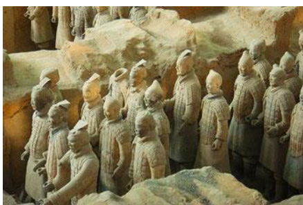
สุสานกองทัพทหารม้าจินซี

พักที่ XINYUAN HOTEL 4* หรือ โรงแรมในระดับเดียวกัน เมืองหัวซาน