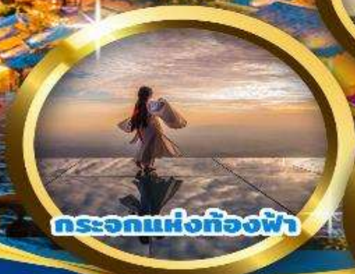
กระโจมห้องท้องฟ้า