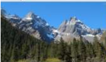
ภูเขาสี่ดรุณี (หุบเขาชวงเฉียวโกว)