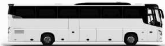
ตัวอย่างรถทัวร์ 1 คัน

ค่าที่พักตามที่ระบุในรายการหรือเทียบเท่าระดับเดียวกัน (ห้องพักละ 2 ท่าน) หากประเภทห้องพักท่านริเวเนสซาเกินจาก เช่น ริเวเนสซาห้องพักเป็น TWIN BED หรือ DOUBLE BED ทางบริษัทขอสงวนสิทธิ์ในการปรับประเภทห้องพัก เป็นตามโรงแรมมีอยู่ โดยไม่ต้องแจ้งให้ทราบล่วงหน้า