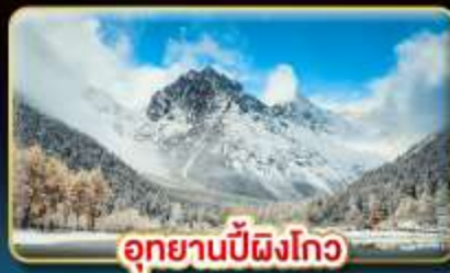
อุทยานปี้ผิงโกว