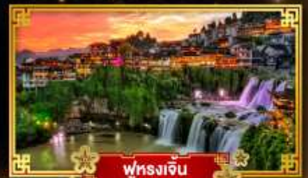
ฟุรงเจิน