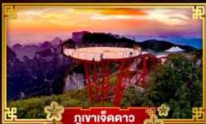
กุเขาเจ็ดดาว