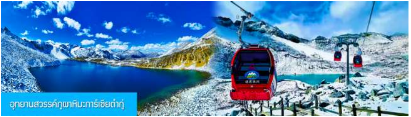
อุทยานสวรรค์ภูผาหิมะการ์เซียต้ากู่