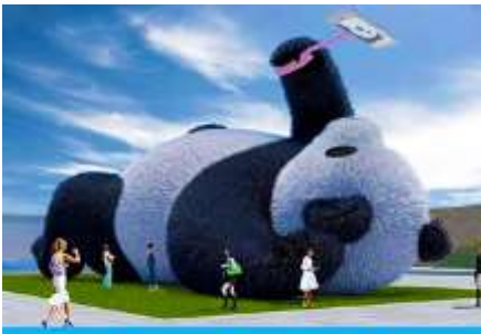
ตุ๊กตาแพนด้าบนเซลฟี

หลังอาหารนำท่านเดินทางสู่ เมืองตูเจียงเยียน 都江堰 (ระยะทาง 234 กม. ใช้เวลาเดินทางราว 4 ชั่วโมง) ระหว่างเดินทางท่านสามารถชมทัศนียภาพธรรมชาติอันงดงามของสองข้างถนนขณะที่รถแล่นผ่าน ที่มีทั้งภูเขาหิมะสูง หุบเขา ธารน้ำ และทุ่งหญ้าบนที่ราบสูง หรือพักผ่อนตามอัธยาศัยบนรถระหว่างเดินทาง