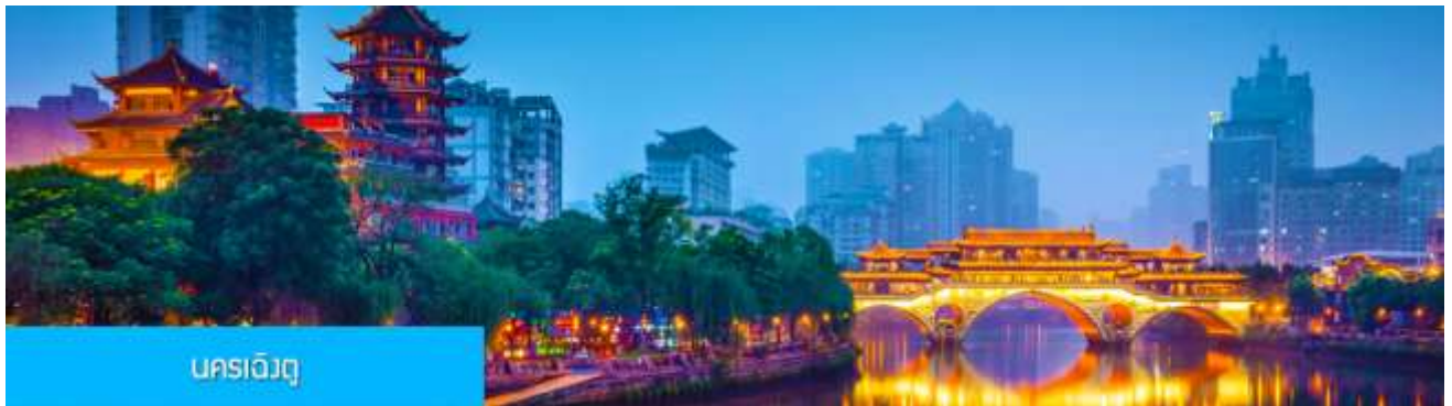
นครเฉิงตู