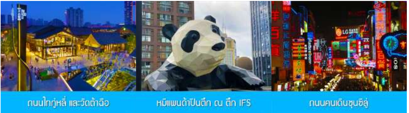
ถนนไท่กุ่หลี่ และวัดต้าฉือ