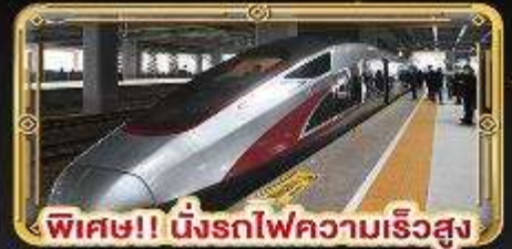
พิเศษ!! นิ่งรถไฟความเร็วสูง