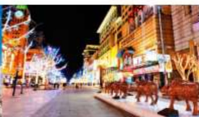
ถนนหวังฝูจิ่ง