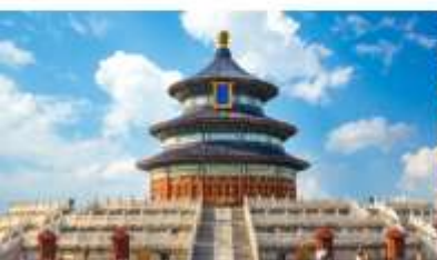
หอบูชาฟ้าเทียนถาน