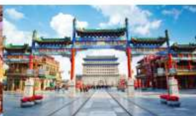
ถนนโบราณเจียนเหมิน