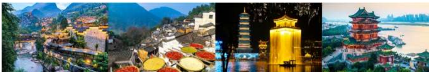
หุบเขาเทวดาฉีเจียนกู่