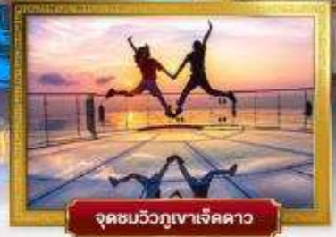
จุดชมวิวกูเงาเจ็ดดาว