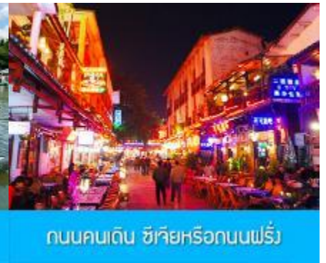
ถนนคนเดิน ซีเจียหรือถนนฝรั่ง