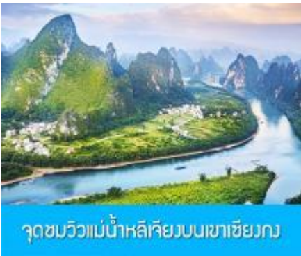
จุดชมวิวม่านน้ำหลีเจียงบนเขาเซียงกง

พักที่ GUILIN VIENNA HOTEL ระดับ 4 ดาวท้องถิ่นหรือเทียบเท่าใน เมืองกุ้ยหลิน