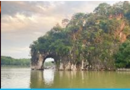
เขาวงช้าง