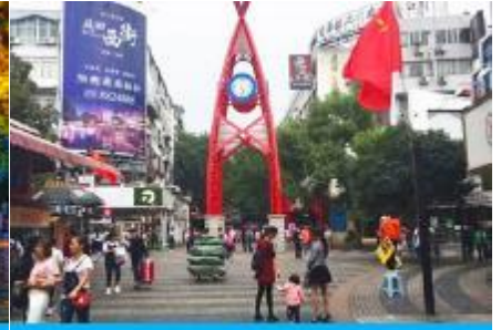
ถนนคนเดิน เจิ้งหยางลุ