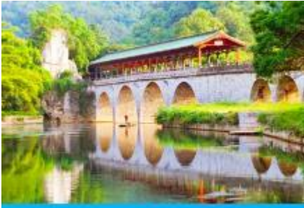
สวนเจ็ดดาว