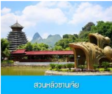
สวนหลิวซานเจีย