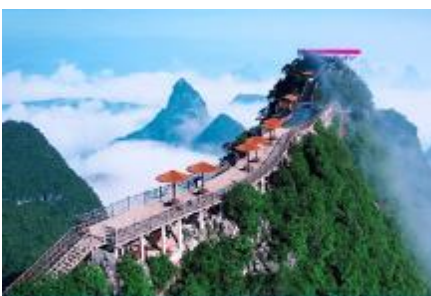
นั่งกระเช้าขึ้นเขาหุ้ยฝง

พักที่ YANGSHUO ELITE HOTEL ระดับ 4 ดาวท้องถิ่นหรือเทียบเท่าใน เมืองหยางชวี่