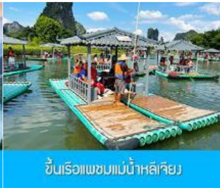
ขึ้นเรือแพชมม่านน้ำหลีเจียง