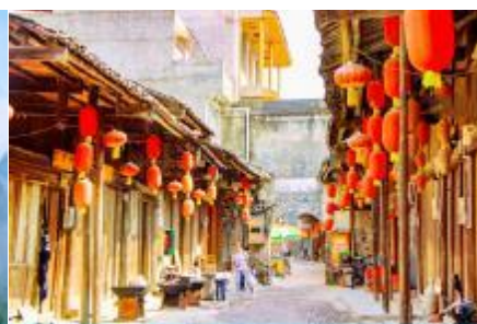
เมืองโบราณต้าชวี