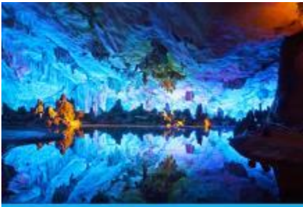
ถ้ำขลุ่ยอ้อ