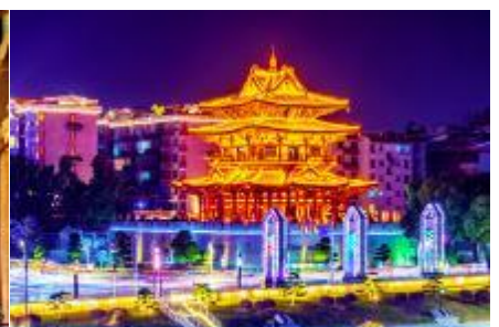
หอชิวเหยาไหล