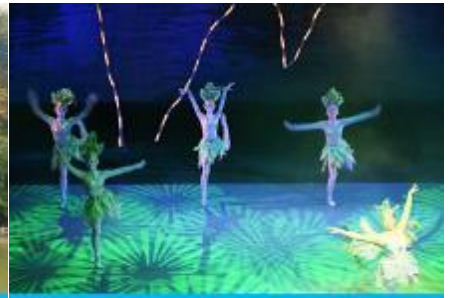
โชว์ DREAM LIKE LIJIANG