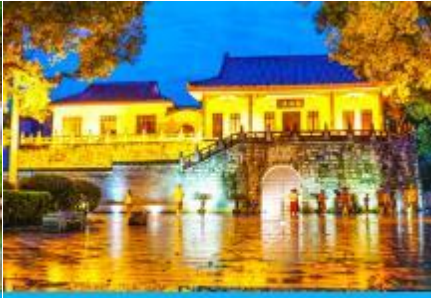
ประตูเมืองโบราณกุหนานเหมิน