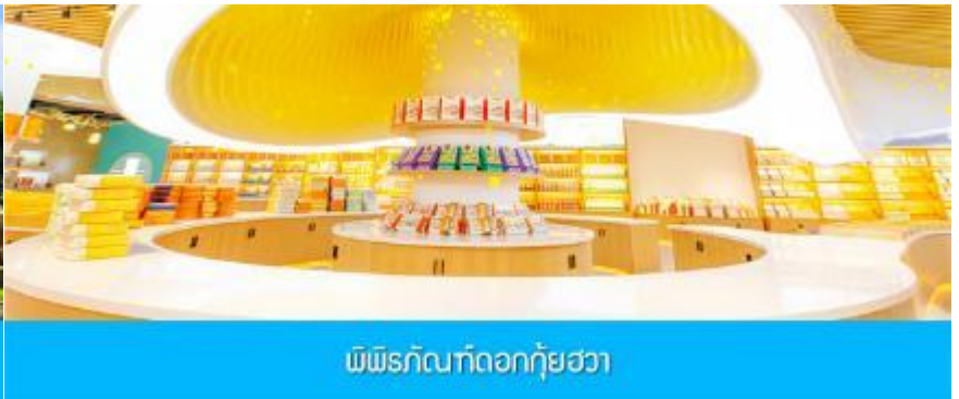
พิพิธภัณฑ์ดอกกุ้ยฮวา