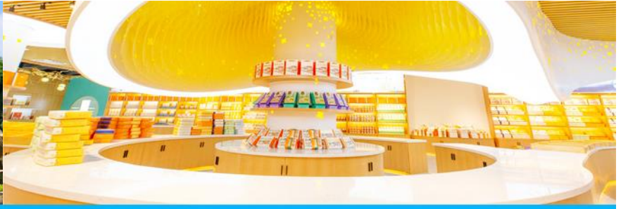
พิพิธภัณฑ์ดอกกุ้ยฮวา