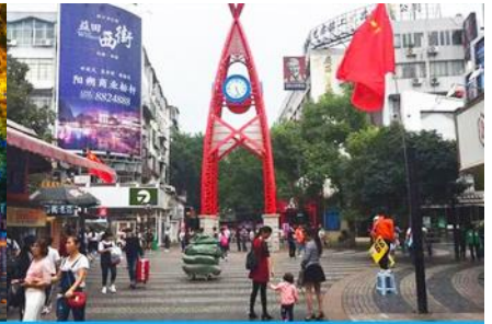
ถนนคนเดิน เจิ้งหยางลู่