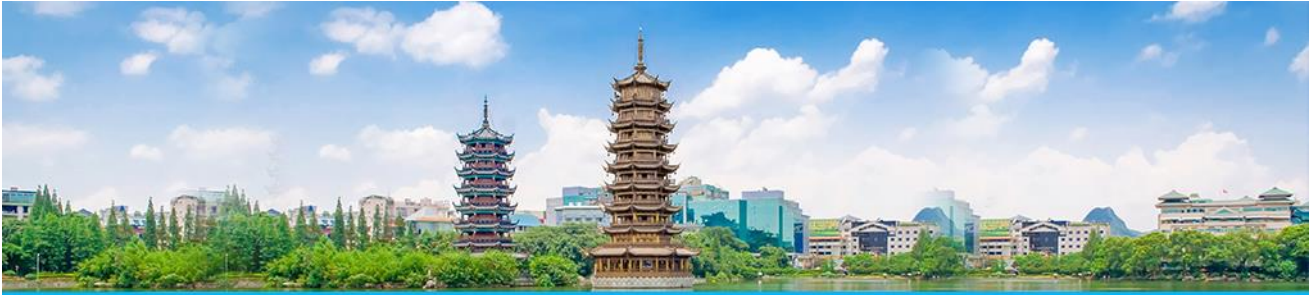
เจดีย์เงิน เจดีย์ทอง