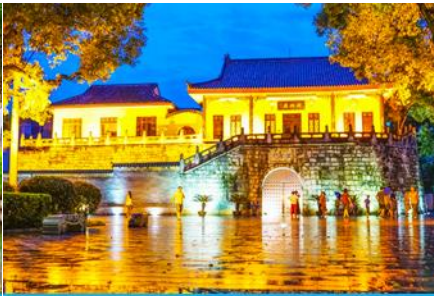
ประตูเมืองโบราณกุ๋หนานเหมิน