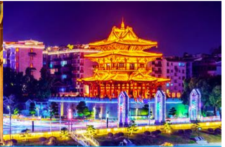
หอชิวเหยาไหลว

วันที่ 1 เมืองหยางชัว – ภูเขาหญู่ฝง – เมืองโบราณต้าชวี – เมืองกู่หลิน – หอชิวเหยาไหลว – ซ้อปี้งย่าน ตงซีเจียง