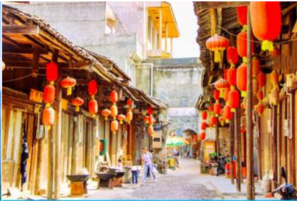
เมืองโบราณต้าชวี