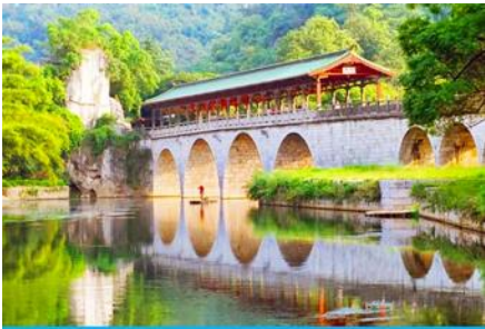
สวนเจ็ดดาว

พักที่ GUILIN VIENNA HOTEL ระดับ 4 ดาวห้องดีนหรือเทียบเท่าใน เมืองกุ้ยหลิน