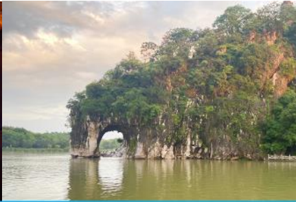
เขาวงช้าง