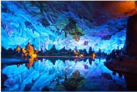
ถ้ำขลุ่ยอ้อ

พักที่ GUILIN VIENNA HOTEL โรงแรมระดับ 4 ดาวท้องถิ่น หรือเทียบเท่าในเมืองกุ้ยหลิน