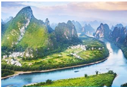
จุดชมวิวม่าน้ำหลีเจียงบนเขาเซียงกง

พักที่ GUILIN VIENNA HOTEL ระดับ 4 ดาวห้องดีนหรือเทียบเท่าใน เมืองกุ้ยหลิน