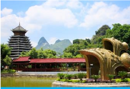
สวนหลิวซานเจีย