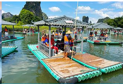
ขึ้นเรือแพชมม่าน้ำหลีเจียง