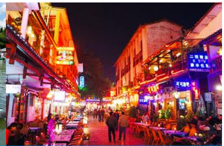
ถนนคนเดิน ซิเจียหรือถนนฝรั่ง

วันที่สาม เมืองกุ้ยหลิน-จุดชมวิวม่าน้ำหลีเจียงบนเขาเซียงกง-เมืองหยางซัว-ขึ้นเรือแพชมม่าน้ำหลีเจียง –ถนนฝรั่ง