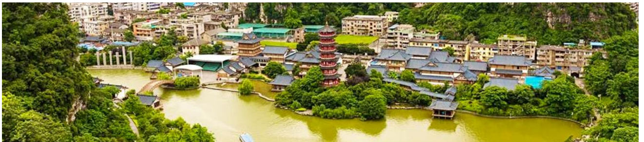
กุ้ยหลิน