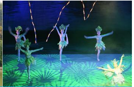
โชว์ DREAM LIKE LIJIANG