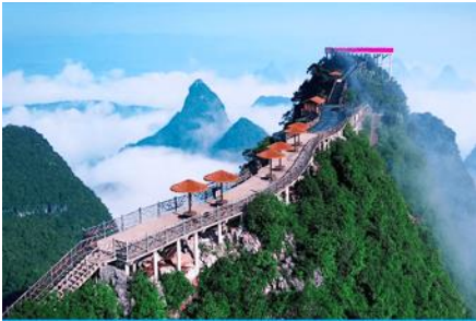
นั่งกระเช้าขึ้นเขาหญู่ฝง

พักที่ YANGSHUO ELITE HOTEL ระดับ 4 ดาวท้องถิ่นหรือเทียบเท่าใน เมืองหยางชัว