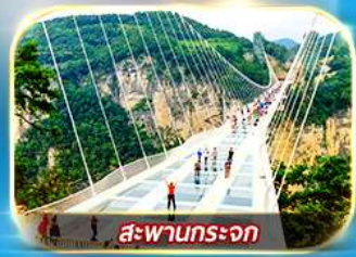
สะพานกระเจก