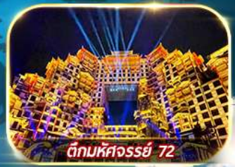
ตึกมหัศจรรย์ 72

เต็มอิ่มกับบรรยากาศเมืองโบราณเฟ่่งหวง เขาเทียนเหมินซาน ประตูลั่ว หมู่บ้านโบราณบนน้ำตกฟู่หลง