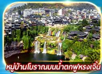
หมู่บ้านโบราณบนน้ำตกฟู่หลงเจิ้น