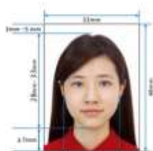
Paper Photo for Visa Application Form