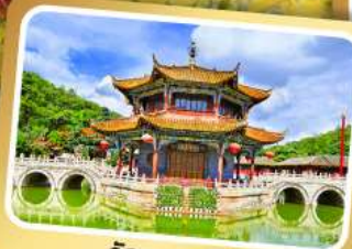
วัดห้วยหนอง