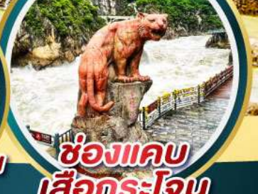
ช่องแคบ เสือกระโจน