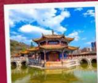
วัดหยวนทอง