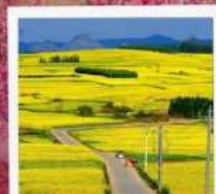
ทุ่งดอกมัสตาร์ด