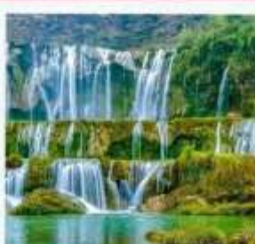
น้ำตกเก้ามังกร