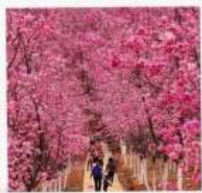
หุบเขาซากุระหมื่นลี