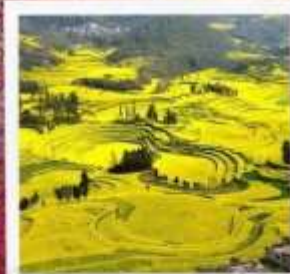
จุดชมวิวกุเขาไก่ทอง