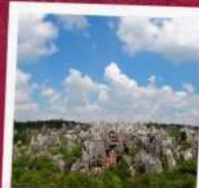
อุทยานป่าหิน