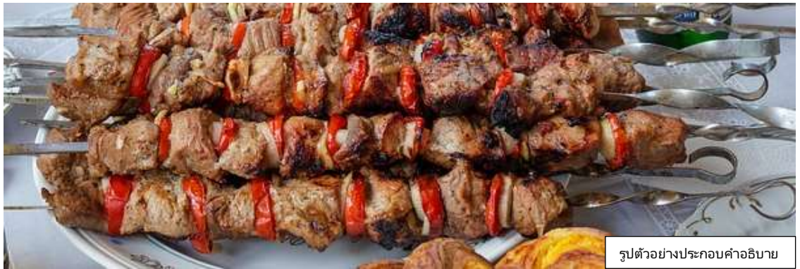
รูปตัวอย่างประกอบคำอธิบาย

เพิ่มพิเศษ เมนูจามรียงเครื่องเทศ 1 ท่าน / 1 ไม้ใหญ่