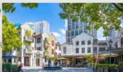
ย่านซินเทียนตี้